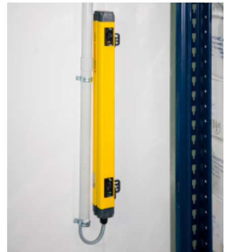
Zewnętrzna bariera bezpieczeństwa

Regały Movirack idealnie nadają się do mroźni, ponieważ dzięki optymalnemu wykorzystaniu powierzchni magazynowej, zmniejsza się zużycie energii w przeliczeniu na zmagazynowaną paletę